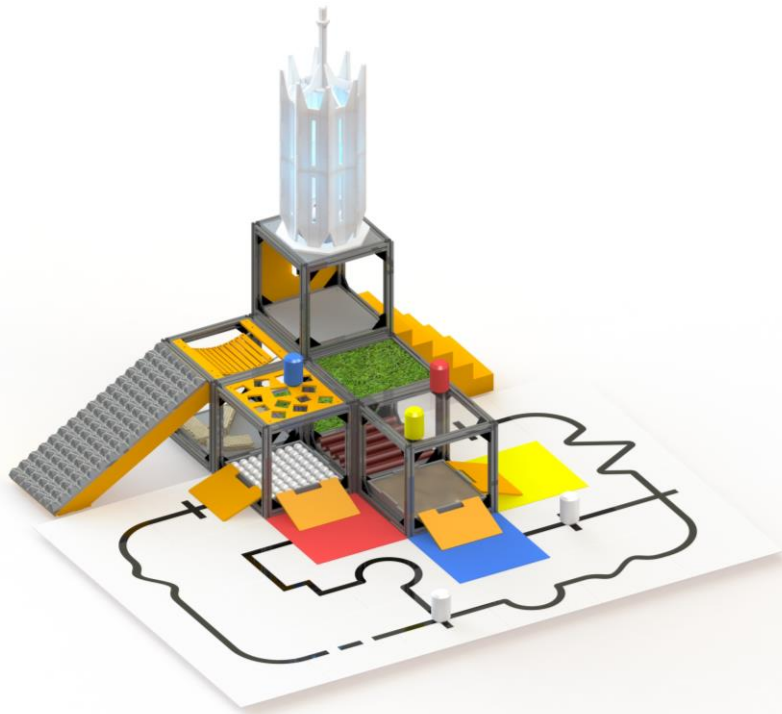
Рисунок 1. «Общий вид конфигурации полигона»