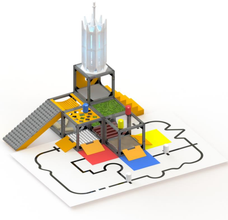
Рисунок 1. «Общий вид конфигурации полигона»