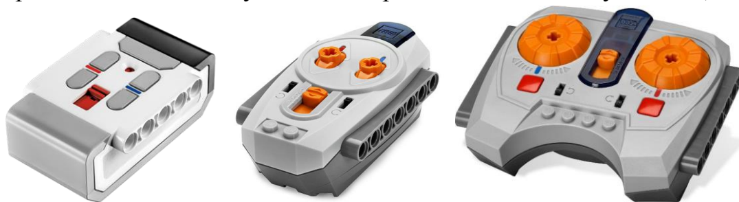
Рисунок 2. «Примеры распространенных ИК-пультов»