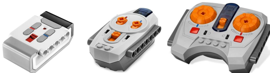
Рисунок 2 «Примеры распространенных ИК-пультов»