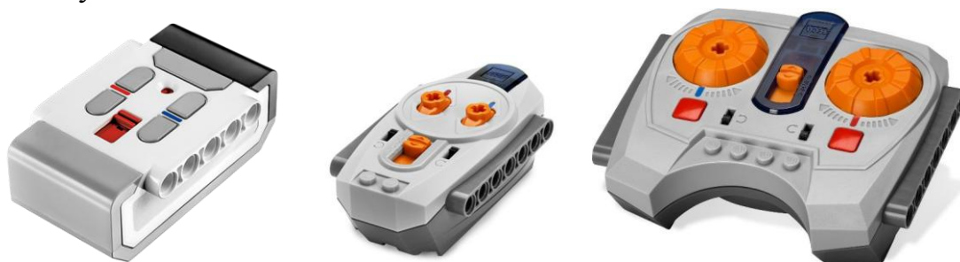
Рисунок 2 «Примеры распространенных ИК-пультов»